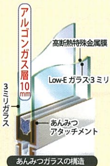
あんみつガラスの構造