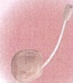
外マイク耳あな型